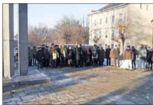
Am Mahn- und Ehrenmal Robert-Koch-Platz/Bahnhofstraße

Über 60 Kamenzerinnen und Kamenzer versammelten sich am 27. Januar 2017, um der Opfer des Nationalsozialismus zu gedenken. Redner unterschiedlichster Religions-, Glaubens- und Politikrichtungen beleuchteten das historische Datum, gedachten in ihren Reden den Opfern und zeigten die Verantwortung für die Gegenwart auf.