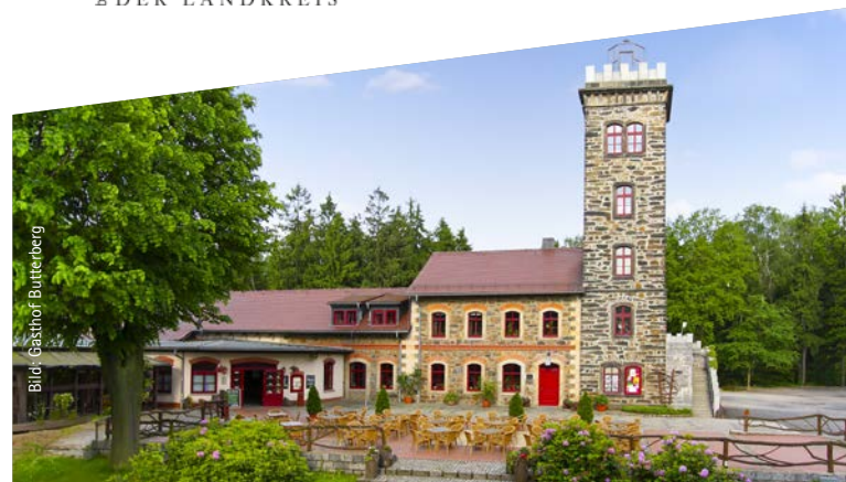
Bild: Gasthof Butterberg