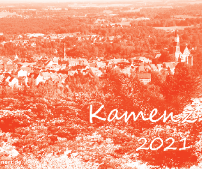
Kalender bei Foto Steinert