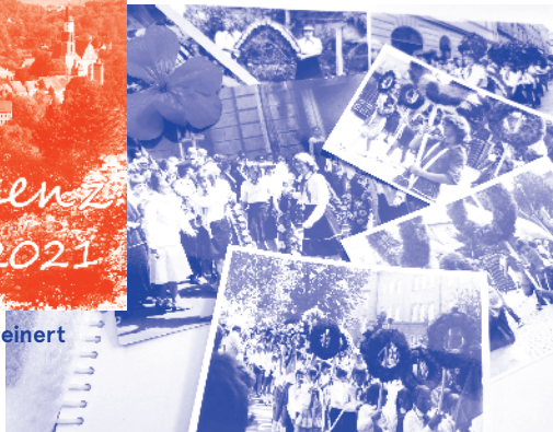
Forstfest-Spezial bei Plan B