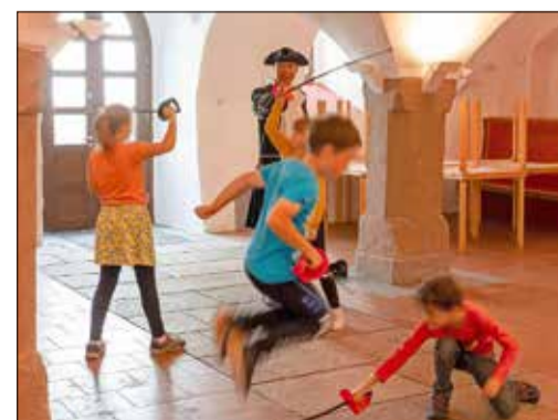
Fechten im Malzhauskeller