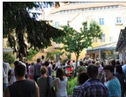
Museum der Westlausitz