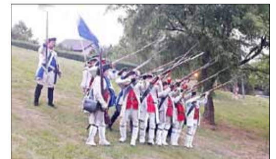
Das Churfürstlich-Sächsische 3. Kreisregiment in Aktion.

Vor 260 Jahren fand bei Kolín die zweite Schlacht im zweiten Jahr des Siebenjährigen Krieges statt. Auch wenn diese Schlacht mit einer verheerenden Niederlage Preußens endete, hatten die beiden Hauptkriegsparteien enorme Verluste zu beklagen: Die Verluste der Preußen in der Schlacht umfassten ca. 13.700 Mann und 1.670 Pferde sowie 45 Geschütze, die der Österreicher betrug ca. 8.100 Mann und 2.750 Pferde. Detail am Rande: Besonders das 1. Bataillon der Leibgarde unter dem preußischen General Friedrich Bogislav von Tautenzien, dem später Gotthold Ephraim Lessing als Privatsekretär zur Hand ging, bewahrte die Armee von Friedrich II vor einer größeren Niederlage. Lessing war es auch, der mit Krieg haderte, zum einen, weil er dessen Greul aus eigenem Erleben kannte und zum anderen, weil er als Mann des Wortes die Lösung von Konflikten niemals in kriegerischen Auseinandersetzungen sah. Hierzu sehe man sich nur seine Äußerungen zu den von Friedrich II geführten Kriegen an oder seine Theaterstücke „Philotas“ und „Minna von Barnhelm“.