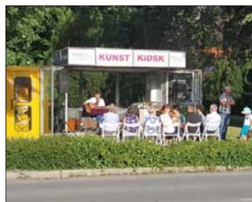
Kunst-Kiosk am Bahnhof