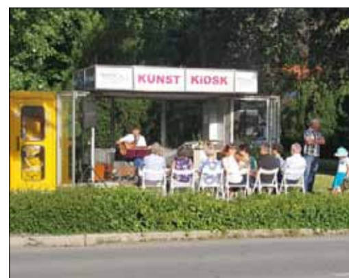
Kunst-Kiosk am Bahnhof