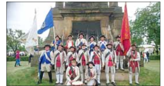
Das Churfürstlich-Sächsische 3. Kreisregiment vor dem Denkmal für die Schlacht bei Kolín.

Vor 260 Jahren fand bei Kolín die zweite Schlacht im zweiten Jahr des Siebenjährigen Krieges statt. Auch wenn diese Schlacht mit einer verheerenden Niederlage Preußens endete, hatten die beiden Hauptkriegsparteien enorme Verluste zu beklagen: Die Verluste der Preußen in der Schlacht umfassten ca. 13.700 Mann und 1.670 Pferde sowie 45 Geschütze, die der Österreicher betrug ca. 8.100 Mann und 2.750 Pferde. Detail am Rande: Besonders das 1. Bataillon der Leibgarde unter dem preußischen General Friedrich Bogislav von Tautenzien, dem später Gotthold Ephraim Lessing als Privatsekretär zur Hand ging, bewahrte die Armee von Friedrich II vor einer größeren Niederlage. Lessing war es auch, der mit Krieg haderte, zum einen, weil er dessen Greul aus eigenem Erleben kannte und zum anderen, weil er als Mann des Wortes die Lösung von Konflikten niemals in kriegerischen Auseinandersetzungen sah. Hierzu sehe man sich nur seine Äußerungen zu den von Friedrich II geführten Kriegen an oder seine Theaterstücke „Philotas“ und „Minna von Barnhelm“.