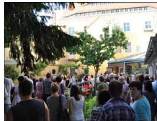
Museum der Westlausitz