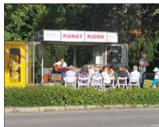
Kunst-Kiosk am Bahnhof