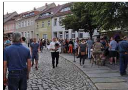
Pfortenstraße Irish Pub