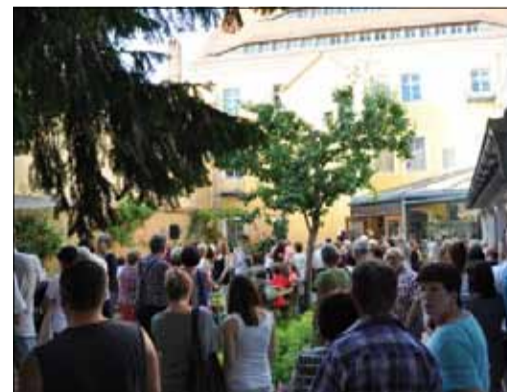
Museum der Westlausitz